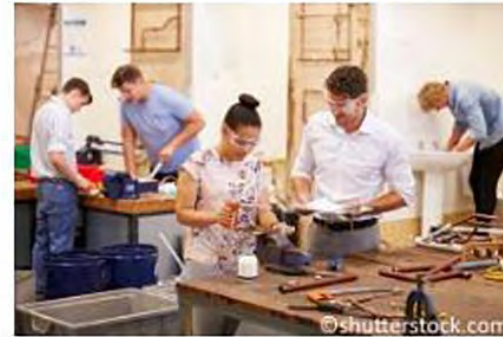
Mesleki Eğitim ve Öğretim